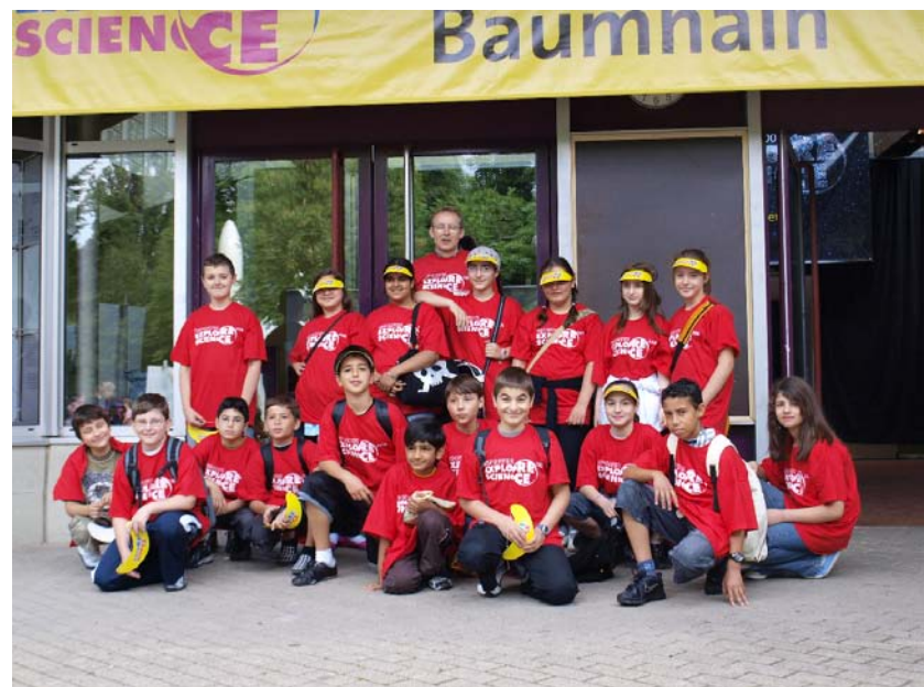
Die Klasse 5b des Mannheimer Elisabeth Gymnasiums.