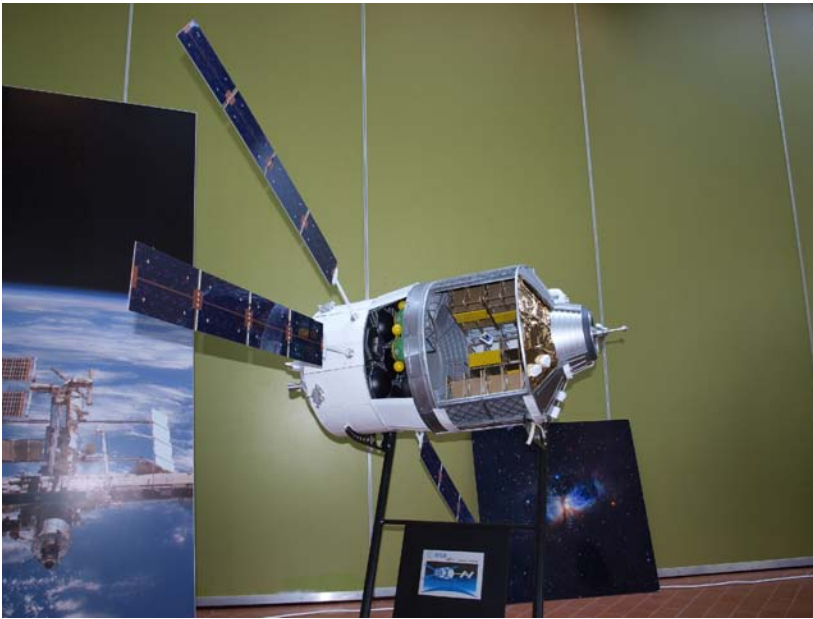
Das automatische Transferfahrzeug der ISS.

European Space Agency (ESA) heißt auf deutsch: Europäische Weltraum Agentur. Sie organisiert